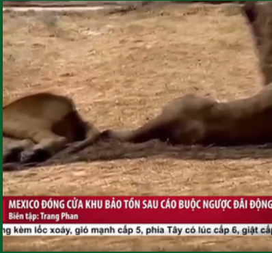
MEXICO ĐÓNG CỬA KHU BẢO TỒN SAU CÁO BUỘC NGƯỢC ĐẢI ĐỘNG Biên tập: Trang Phan ng kèm lốc xoáy, gió mạnh cấp 5, phía Tây có lúc cấp 6, giật cấp